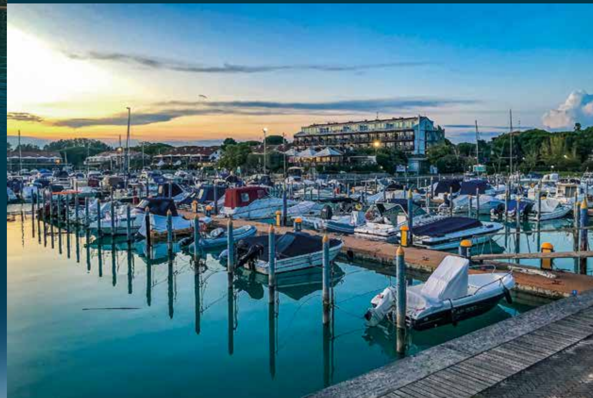
Lignano Sabbiadoro, il porto turistico Marina Uno, marina resort situato sulla foce del fiume Tagliamento. Nella pagina accanto, in alto, la Conca di Bevazzana sul Canale Tagliamento, parte della Litoranea Veneta, da cui si raggiunge la Laguna di Marano. In basso, una vista dall'alto di Lignano Sabbiadoro, dal Fiume Tagliamento alla sua lunga spiaggia dorata (foto di Ulderica Dal Pozzo). Nella pagina di apertura, il Villaggio dei Casoni nella Riserva Naturale Regionale Foci dello Stella, dove il tempo sembra essersi fermato.

Lasciata Lignano Sabbiadoro si entra nella vicina Bocca dei Tre Canali sulla Litoranea Veneta, da cui partono a raggiera le principali vie d'acqua. Verso occidente si inoltrano il già citato Canale Tagliamento, il Canale Coron, che arriva ad Aprilia Marittima – un altro hub di ottimi porti turistici –, e il Canale Cialisia che porta al fiume Stella – navigabile – e all'omonima Riserva Naturale. Una zona umida protetta di 1377 et-